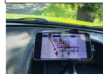
onderweg - auto even aan de kant

Er werd in deze dagen intensief met jullie meegeleefd. Dat kan je lezen in de appgroep van de supporters, maar ook in de andere appgroepen van de