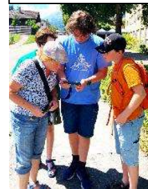
tijdens een bergwandeling